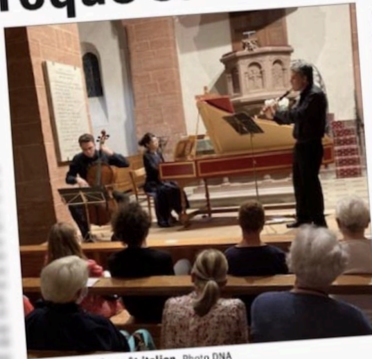
Sonates dans le goût italien.

compositions « nationales » (ici, en particulier le grand Van Eyck, compositeur hollandais et son inoubliable air et variations sur le chant du rossignol) que les emprunts venus d'ailleurs.